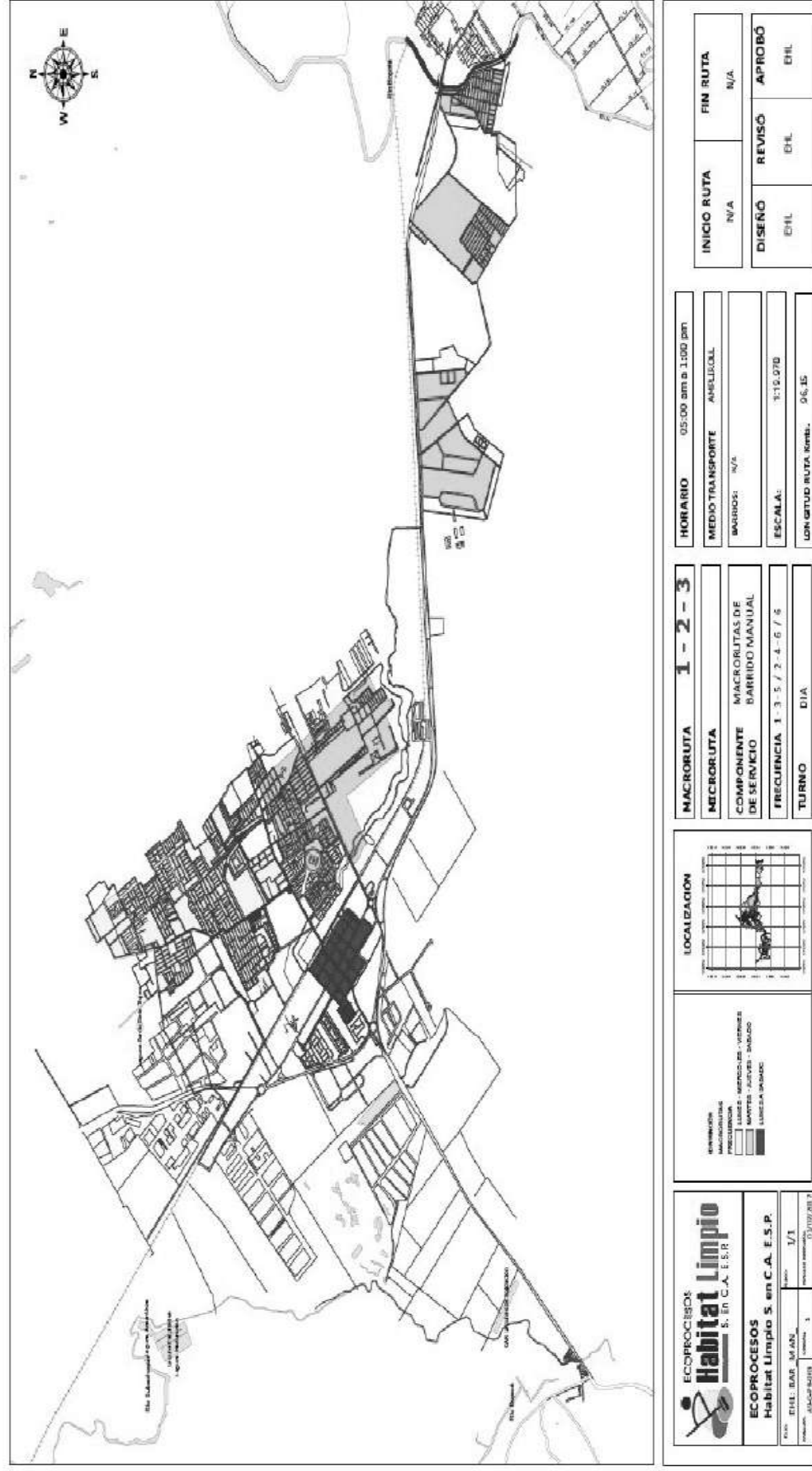
Figura 3. Plano 3. Macrorutas Barrido manual y limpieza